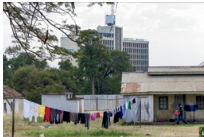
Nieuwbouw naast vertrouwd beeld van vroeger