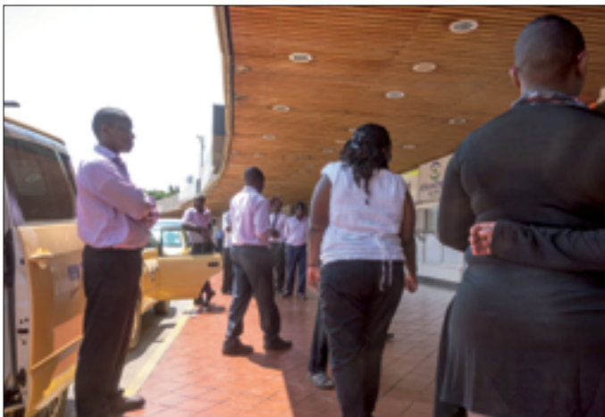
Nairobi airport voor de brand