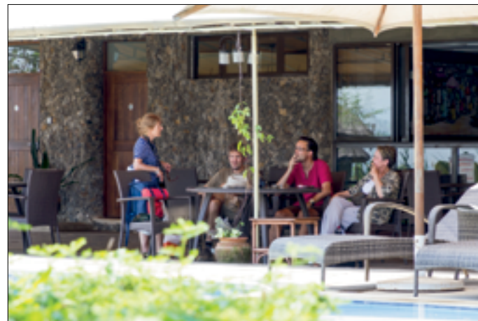
Sommigen moeten altijd roken