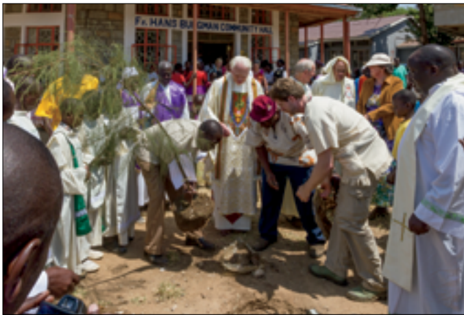
Bomen planten. Hier de boom van de 'Vrienden van'