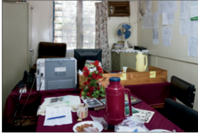
Mijn voormalig kantoor is niet veranderd