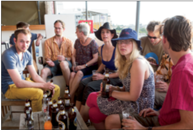
Pandipieri-gangers op het dakterras van de 'Duke'