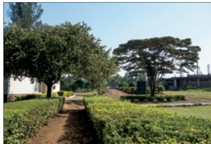
Achter het hek van LBDA

zelfs wanneer de rivier tamelijk rustig stroomt, te hoog.