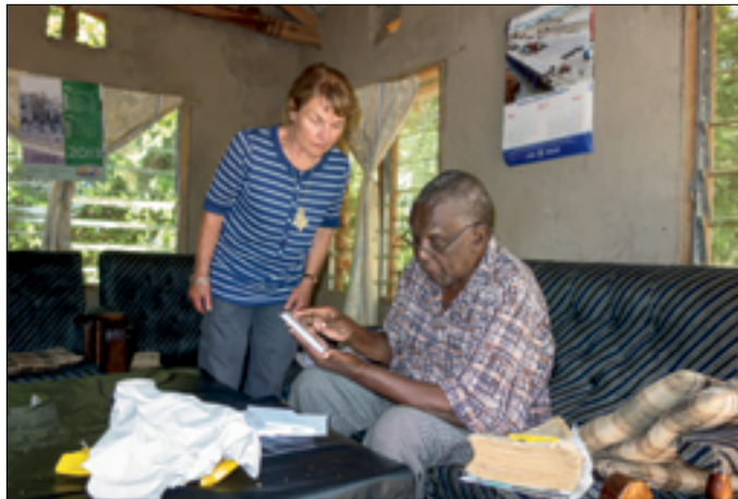
Binnen de foto's bekijken