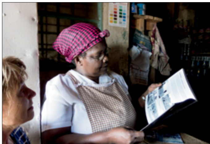
Eén voormalig lid heeft nu hardware shop