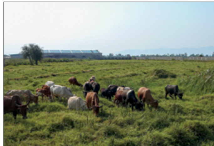
Demo-veld van het widows project

Nu wordt een begin gemaakt met fase 2, aanleg van een identieke 2 e pijplijn (1,25 m diam, 750 m lang) naast de eerste. Ik ben onder de indruk dat het 25 jaar na dato nog goed werkt en relatief onbeschadigd is. Wel zijn er grote beschadigingen aan de linkeroever; daar zal spoedig iets aan moeten gebeuren (gabions) wil de overlaat niet ondermijnd worden.