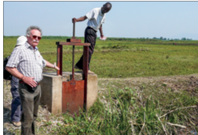
30 jaar later functioneert het kunstwerk nog steeds