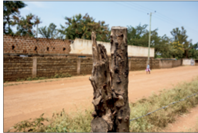
Hier hing de camera; nu niet meer