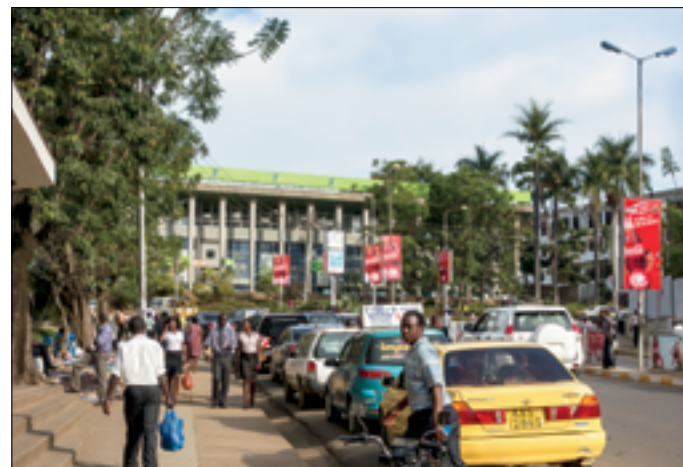
Weer terug in Kisumu

opnieuw onderhandeld worden, vermoedelijk met te weinig buurtbewoners, en komt men niet tot overeenkomst. Ook is het mogelijk dat een kapotte pomp het einde van activiteiten heeft veroorzaakt. Hoe dan ook: waarschijnlijk heeft het project zo'n twintig jaar dienst gedaan en was het een voorbeeld voor een cluster van zes andere projecten in de buurt: Ugambe. Daar werkt ook niets meer; dus, als 'pilots' hebben deze projecten niet gebracht wat we gehoopt hadden.