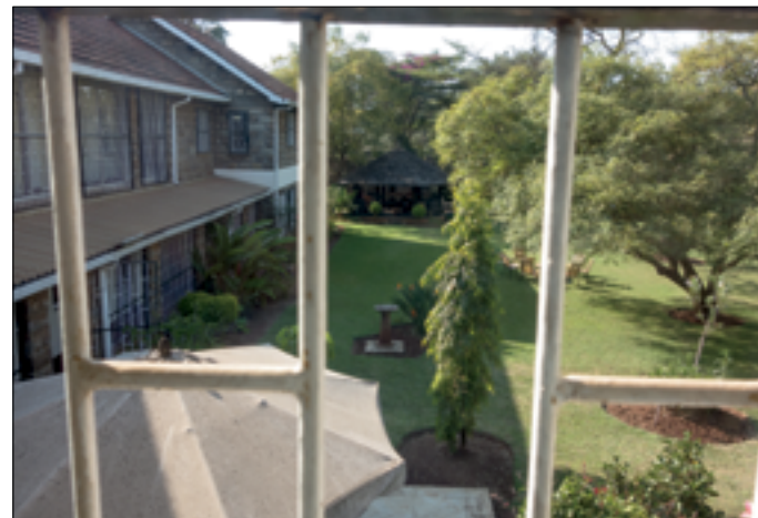
MillHill guesthouse te Nairobi