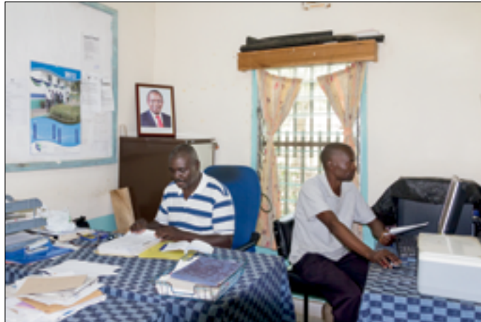
Ahero Irrigation Office