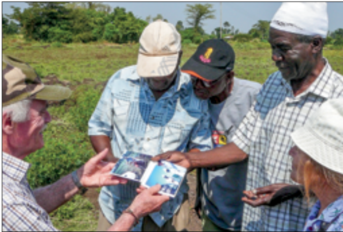
Foto's van toen tonen aan voormalige secretaris