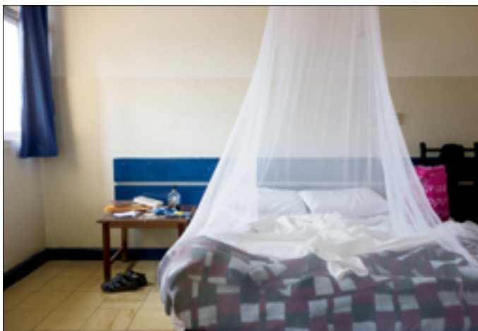
Onze slaapkamer om 7:30 uur