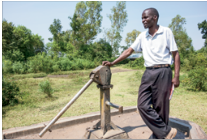
Shallow well van LBDA heeft tijd niet doorstaan