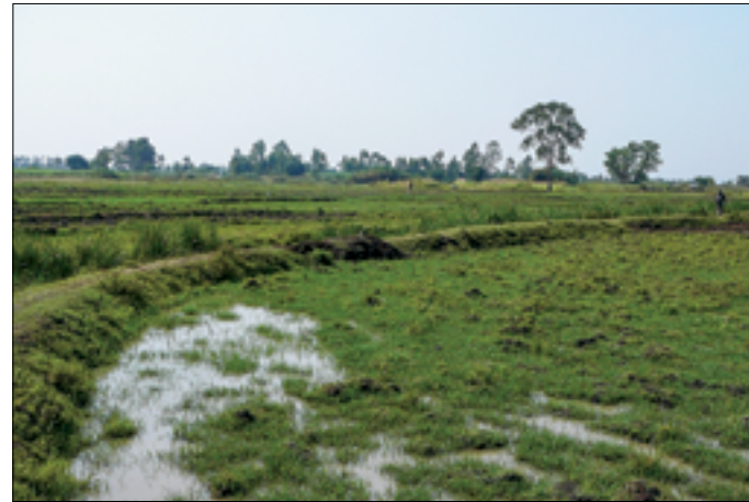
De dijk is dramatisch geslonken