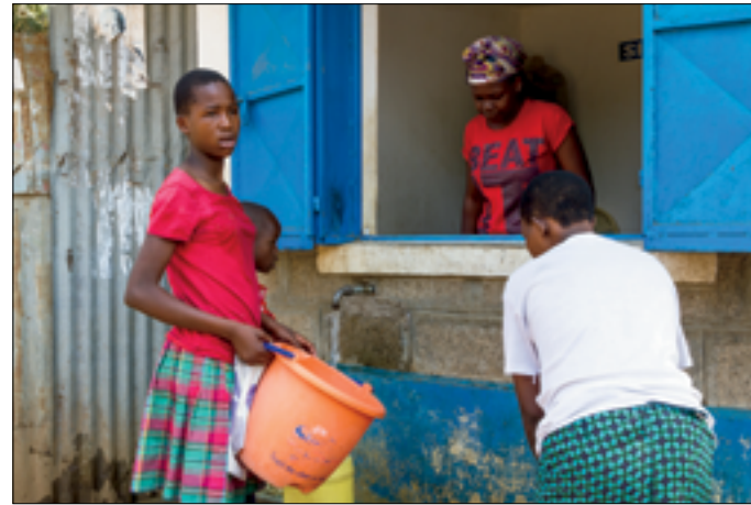
Water Kiosk, tanken voor een paar centen