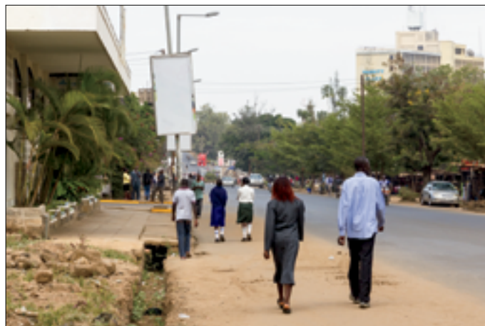
Kisumu, niet veel veranderd sinds 1987