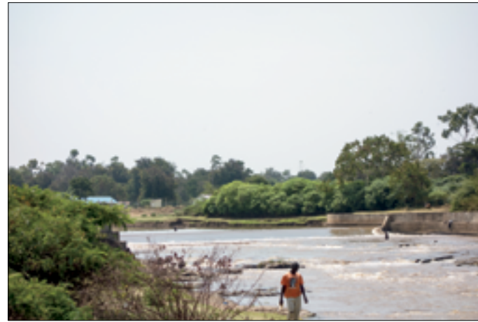
Overlaat in de Nyando River tbv SWK-inlaat