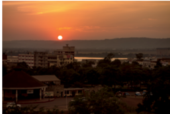
Zonsondergang vanaf het dakterras