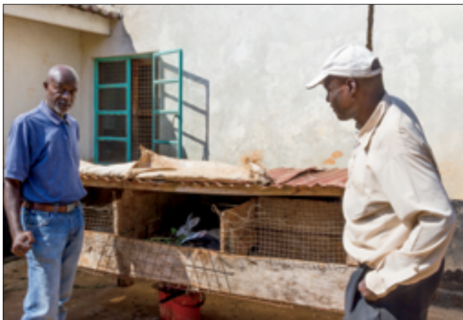
Konijnen fokken, zoals het niet moet