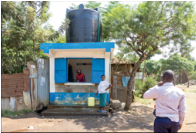
Water Kiosk voor huurders