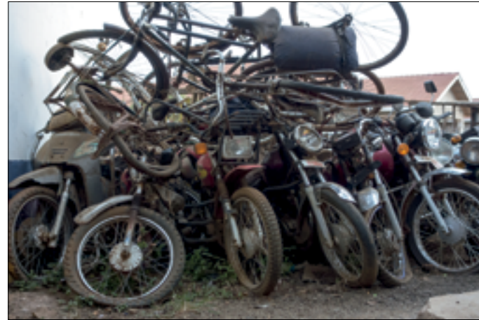
Dit hebben ze ook op het politiebureau