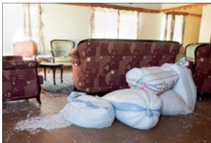
Zijn echtgenote is advocate in Nairobi. Kun je zien!