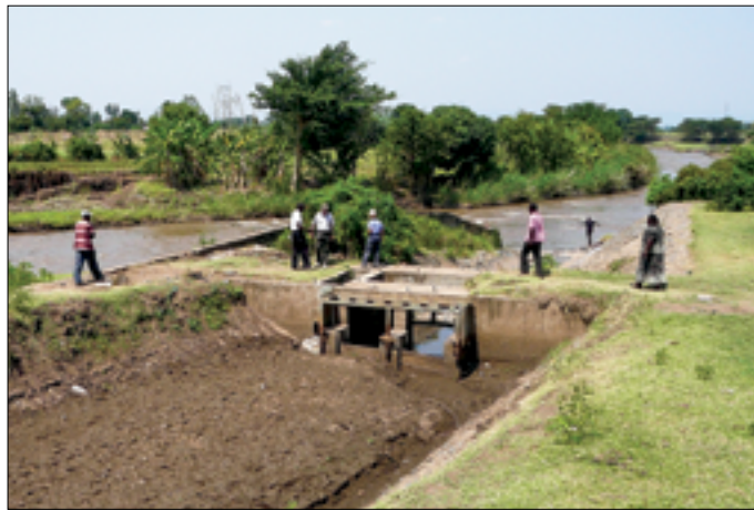
Einde van by-pass met uitlaatwerk