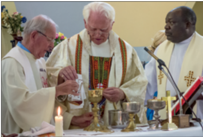
De 3 Heren-mis op zondag