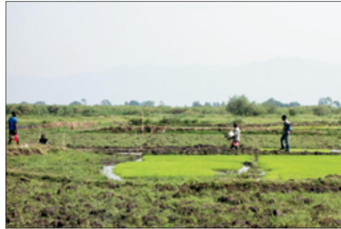
Nursery klaar voor het uitplanten