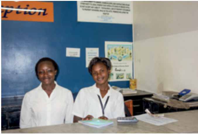
De receptie van de 'Duke of Breeze'