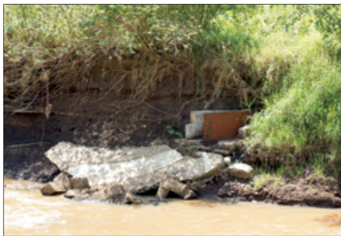
Voormalige intake, nu 2m onder huidige oever