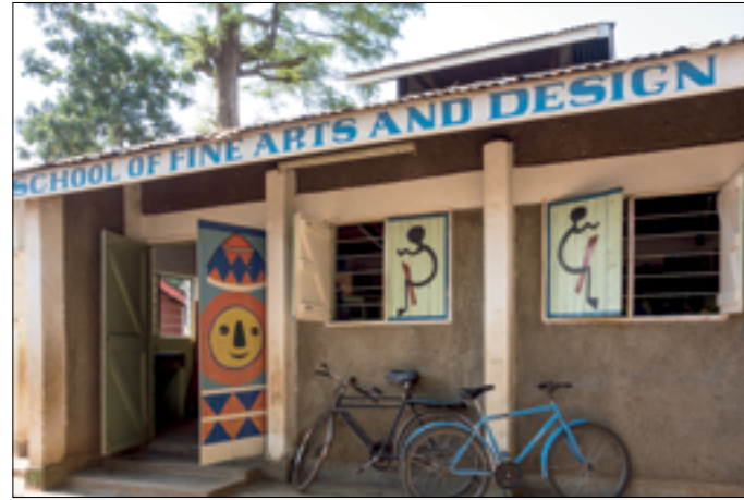
Magadi Art School