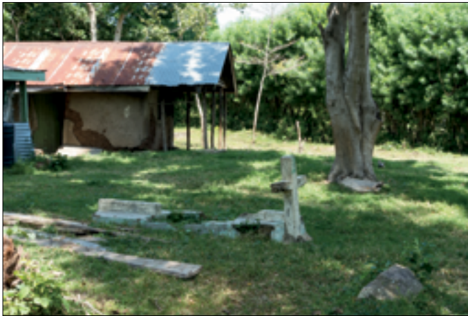
Ouderlijk hus van Gaudencia