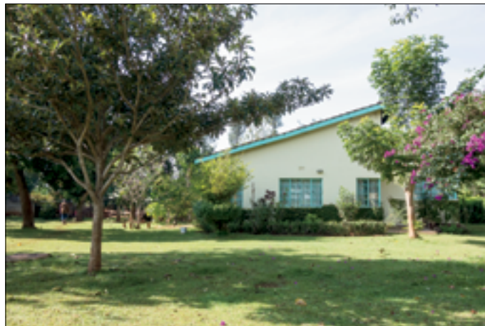
Compound van Edwin Otieno in Yala town