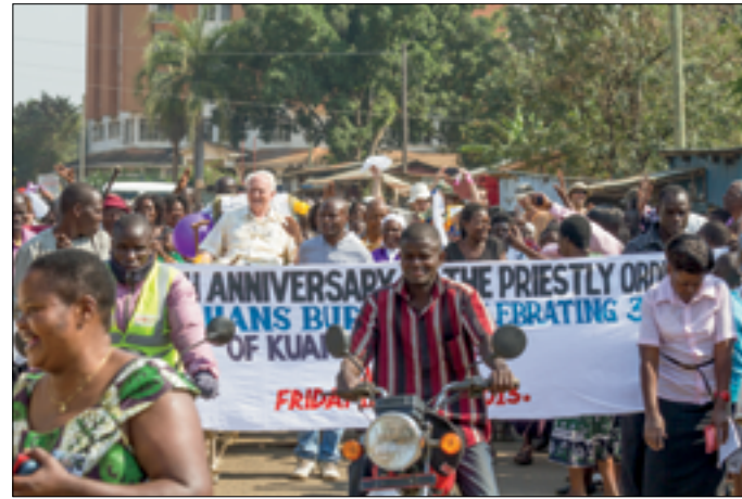
De stoet naar Pandipieri