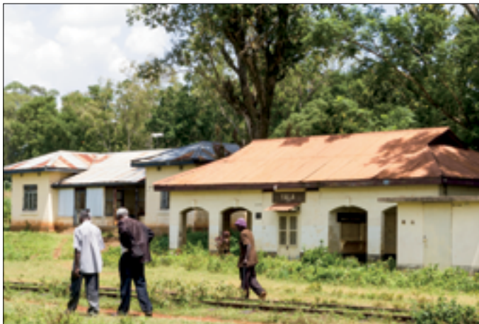
Moi heeft de railways in Luo-land 'afgeschaft'