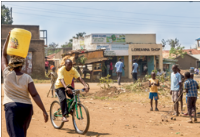
Met drinkwater naar huis