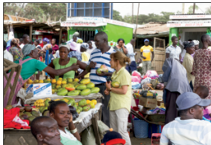
Nog even mango's op Ahero markt kopen