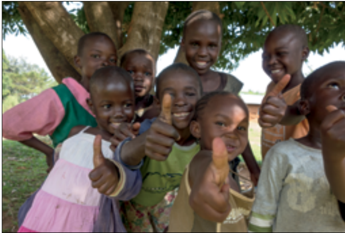
De enige foto die over is van de wandeltocht