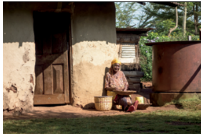
Zijn moeder van 94 schoont de peulen