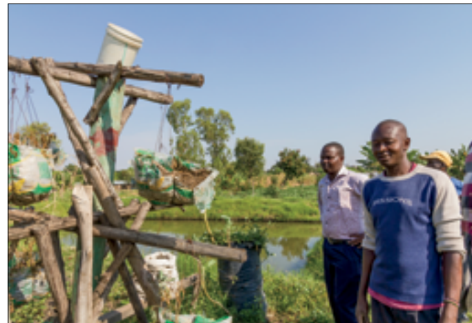
Demo van hangende tuinen