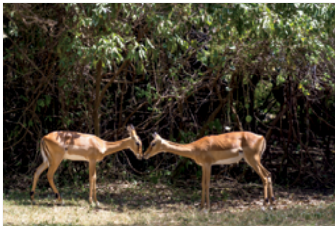
Impala Sanctuary, Kisumu. Entree: € 13,- pp