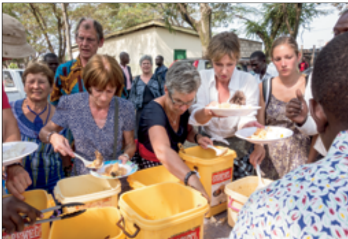
De 'Dutch guest' bedienen de armen