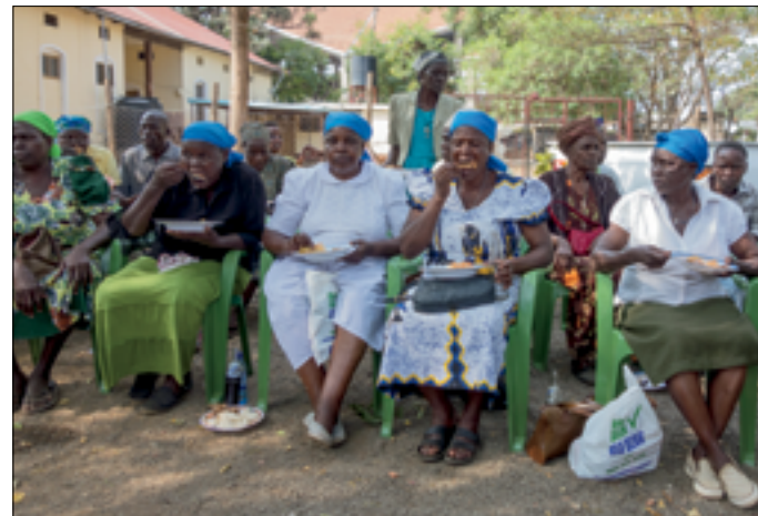
Ze eten er lekker van; maar, is dit wel de doelgroep