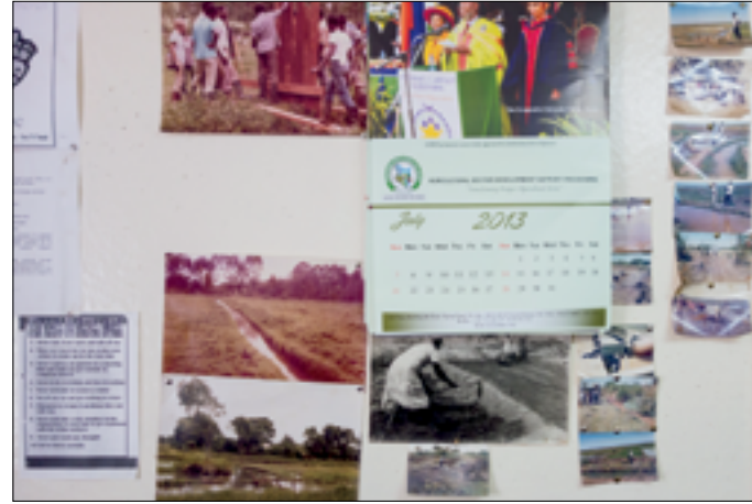
Mijn foto's op het prikbord zijn nog niet ververst