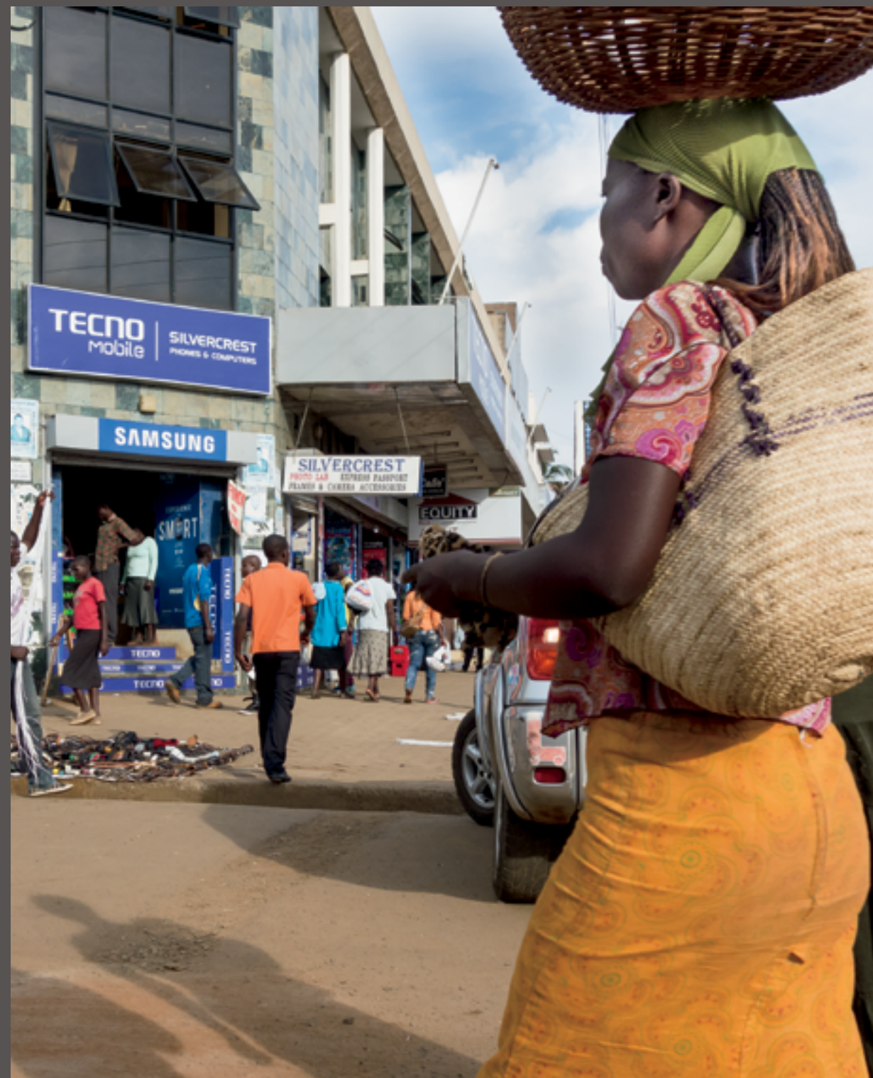
Tekst, foto's en grafische vormgeving: Silvester Povel

Dit boekje kan ook on-line gelezen worden op: http://www.povel.eu/Kenia_Boekje.pdf