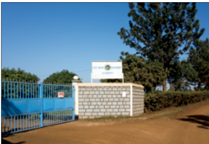
Nieuw kantoor van LBDA in Mamboleo