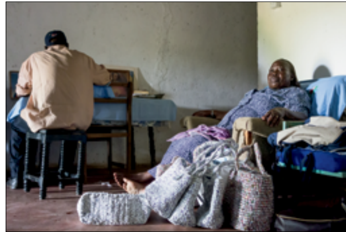
Florence met haar cadeau-tassen en broer van G.