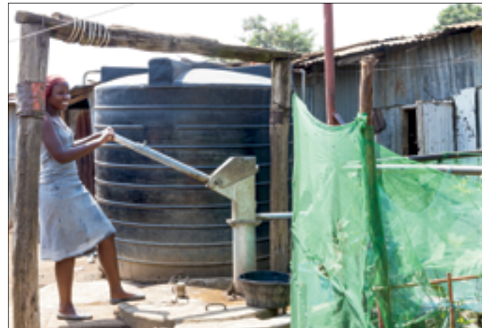
Shallow well voor de was

Inmiddels is o.a. het volgende gerealiseerd: 5 shallow wells, 16 natuurlijke bronnen beschermd (spring protection), 24 school-hygiëne programma's en een 'buizen'-drinkwater project in Magadi. M.b.t. dat laatste: i.s.m. de Kisumu Water & Sewage Company (KIWASCO) zijn over een afstand van ruim 2 km gecontroleerde (meters) drinkwateraansluitingen aan de huizen in de wijk gemaakt. Verder zijn er ongeveer 6 water kiosken op hetzelfde drinkwaternet in de wijk aangesloten t.b.v. de mensen die een huis huren. De shallow wells worden gebruikt voor waswater. KUAP werkt ook aan een borehole met tank voor drinkwatervoorziening in een andere buurt.