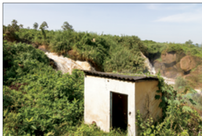
Verlaten pomphuis voor 2 hydro-ram pompen