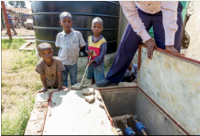
Water huisaansluiting met meters