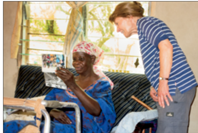
Phoebe met looprek op de voorgrond