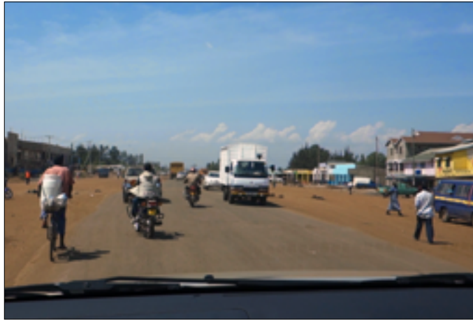
Op weg naar Bondo