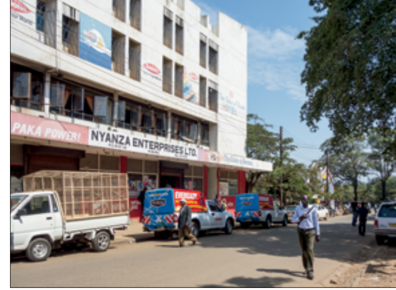
Duke of Breeze, Kisumu