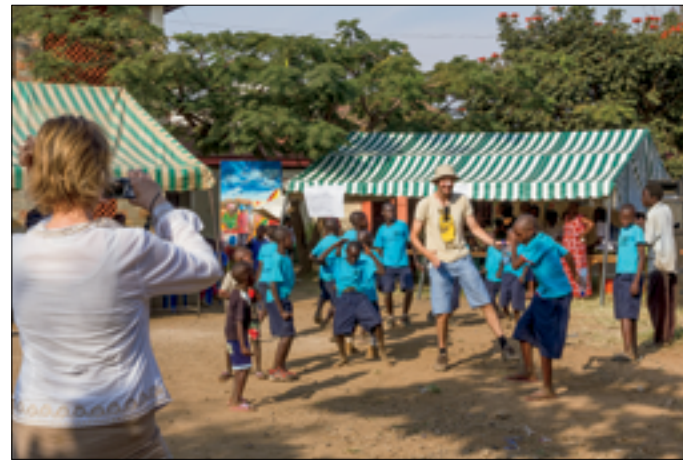
In de pauze dansen met de jeugd