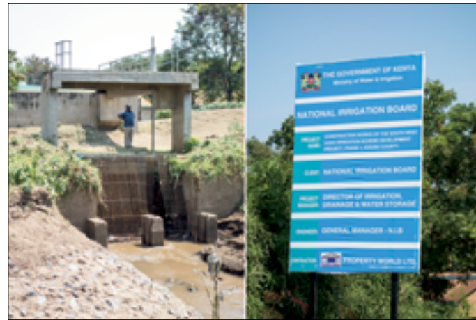
Inlaatwerken. NIB werkt nu goed mee