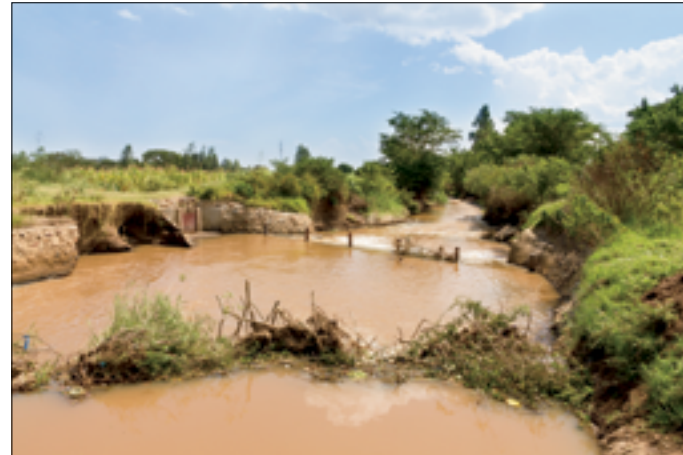
'Nieuwe' inlaat Awach River