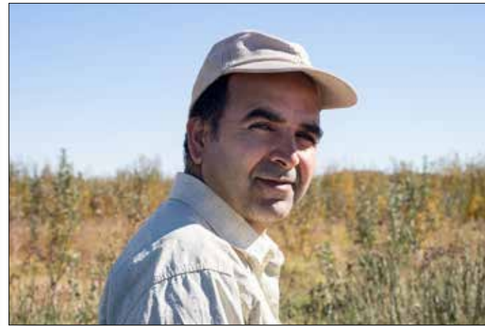
Majid als appelteler