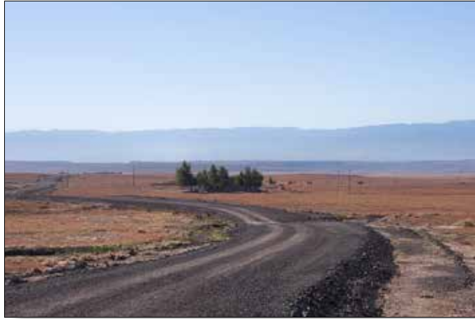
Op weg naar het meest afgelegen veld van 150 ha