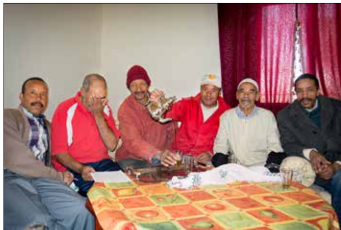
Bijeenkomst van dorpsoudsten