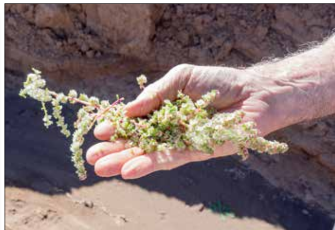
Chenopodium polyspermum. Ook het onkruid links