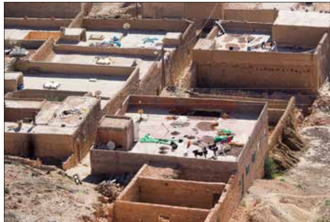
De huizen van boven gezien