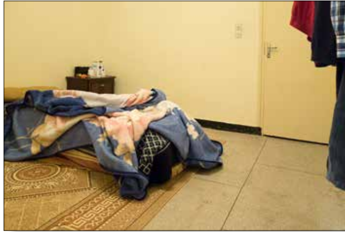
Mijn (inpandige) slaapkamer