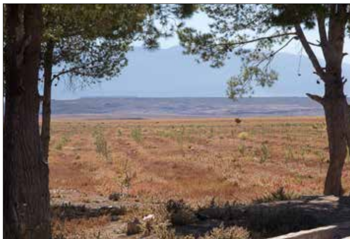
Het wieden loopt achter op schema?