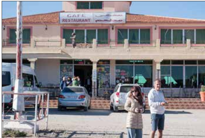
Ik slaap op de 1e verdieping; Overdag veel, vooral lokale, toeristen