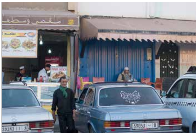
Laatste afspraak in Zaida