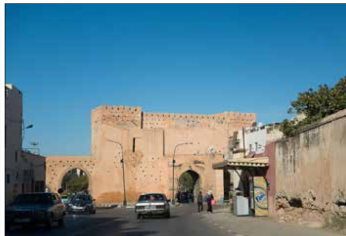
Oók nog even door Meknès