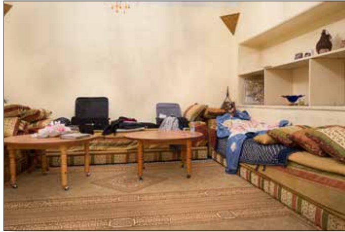
Mijn slaapplek voor de eerste nacht in de mooiste kamer van het huis