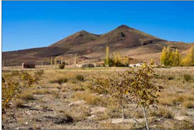
Boompjes groeien in heel kalkrijke bodem