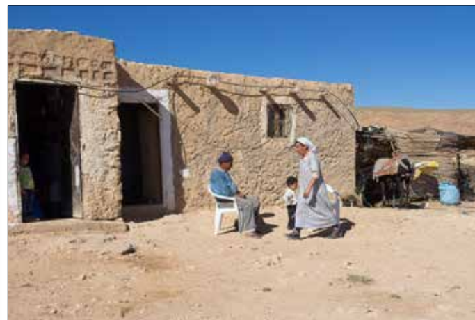
Werkers wonen met gezin bij de velden