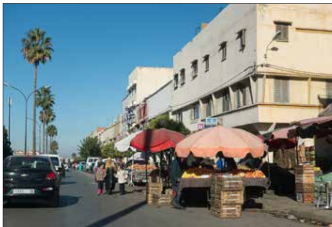
Plaatsje op de terugweg