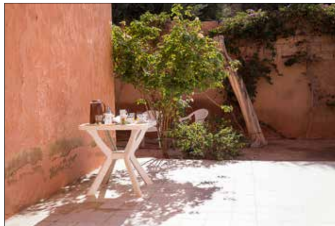
Ontbijt staat klaar op het terras