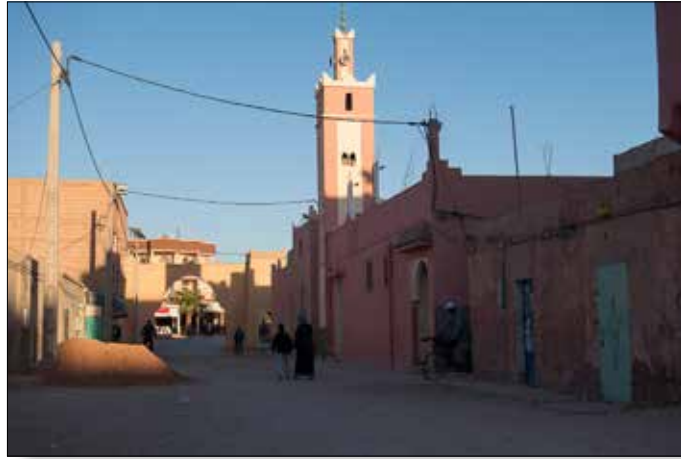
Terugweg vanaf 'Vaders landje'