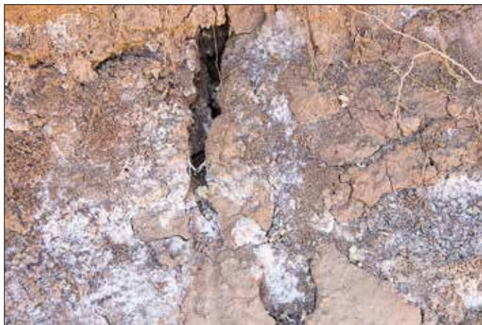
Eén veld is veel te zout