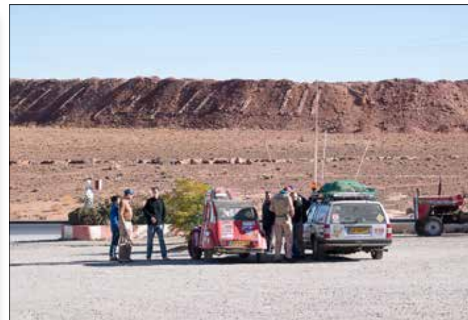
Een Nederlandse caravaan op weg naar Dakar één nachtje in hetzelfde hotel. Achtergrond rest van oude mineralenmijn.

We rijden eerst oostwaarts van Rabat naar Meknès over de autoroute, daarna naar het zuiden over Azrou naar eindbestemming Zaida richting Midelt. De wegen zijn prima. De weg naar het zuiden is een door-gaande tweebaansweg, de N13, die ook veel door toeristen wordt genomen. We steken tweemaal een bergketen over en zijn dan in de Midden-Atlas op 1500 m hoogte.