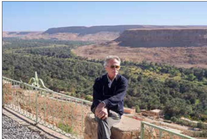
Meer een slenk dan een oase