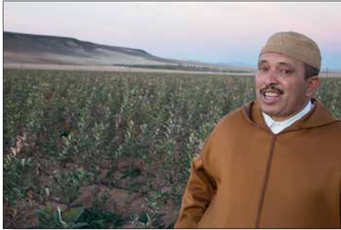
De voorzitter van de Telers Vereniging van Boumia