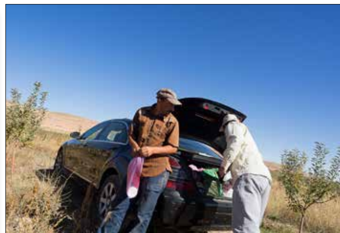
Alles wat nodig is komt uit die achterbak