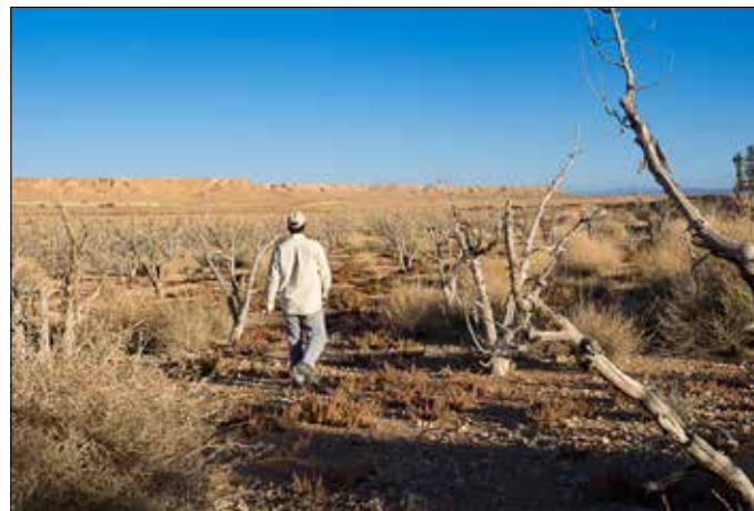
Overgenomen plantage, waar Majid opnieuw gaat beginnen