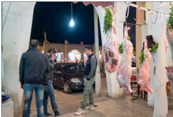
Jeugd buiten het restaurant