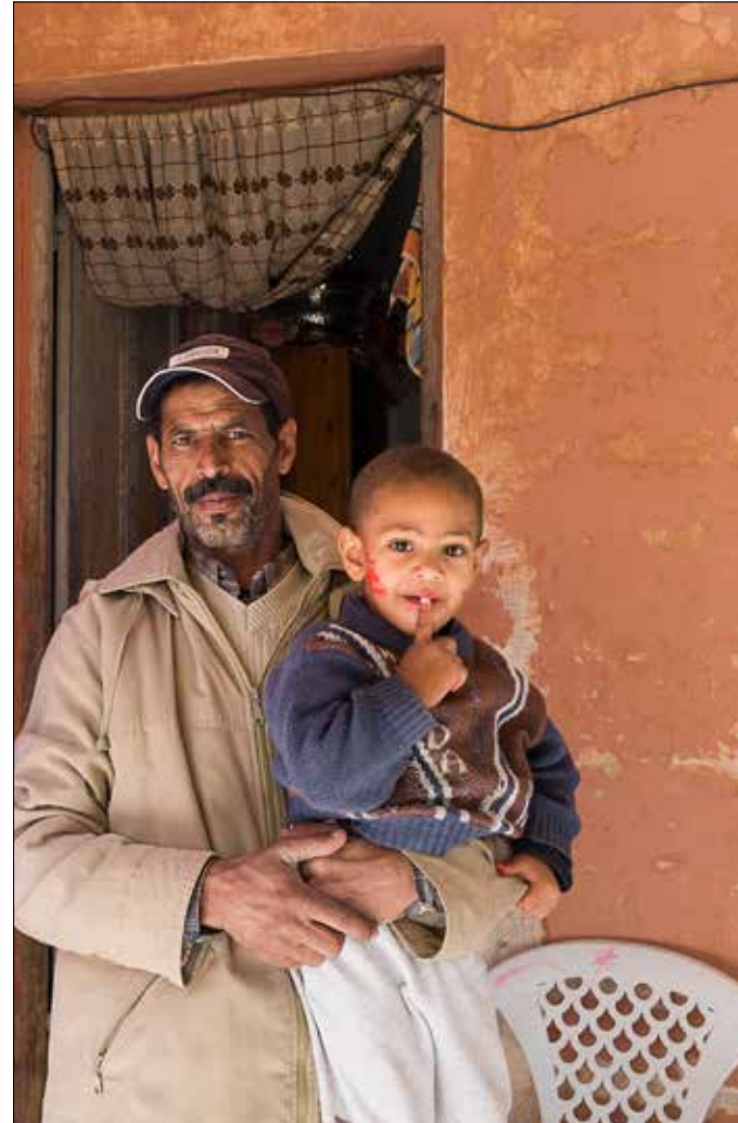
Bediende met zijn jongste kind