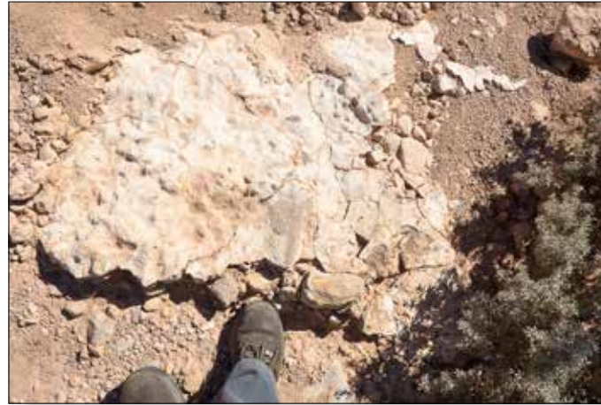
Hier wordt eventueel een plantgat gemaakt