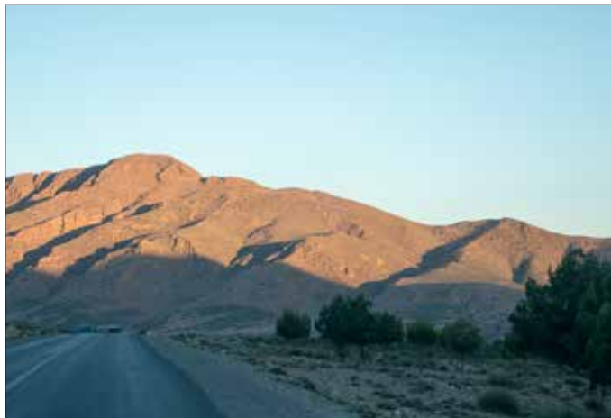
Op weg naar Errachidia