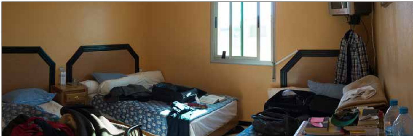
Je kunt je gat nauwelijks keren met al die bedden