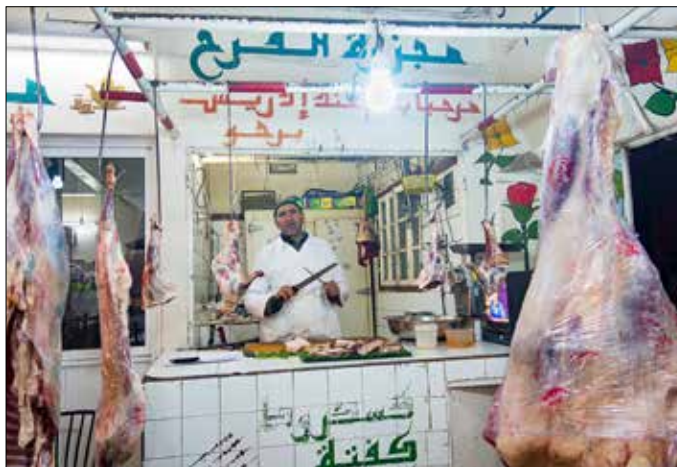
Keuken van plaatselijk restaurant, Zaida