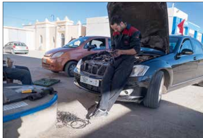
Na nog de juiste V-snaar zien te vinden