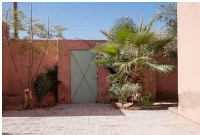
Ik kan er niet uit, omdat ik geen sleutel heb om terug te komen