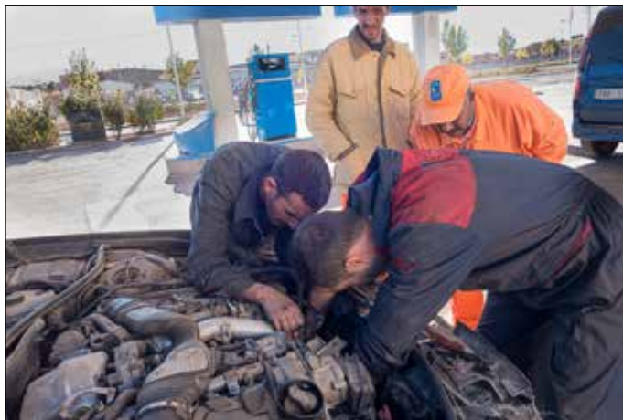
Autopech na Moskeebezoek