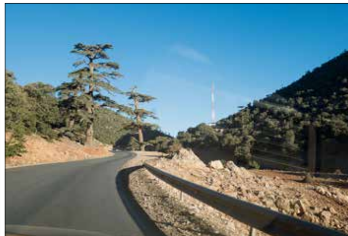
Cederbos wat hoger in het Atlasgebergte