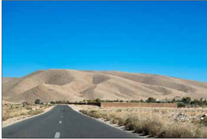
Bergen met prachtige geometrische vormen