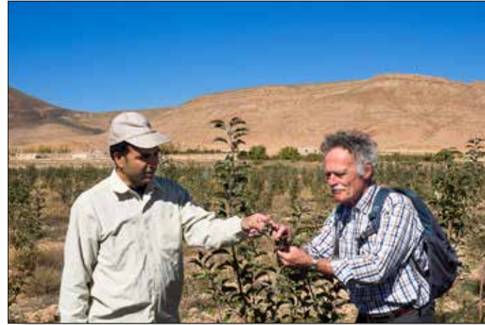
Pauzeren voor een foto als bewijs voor PUM