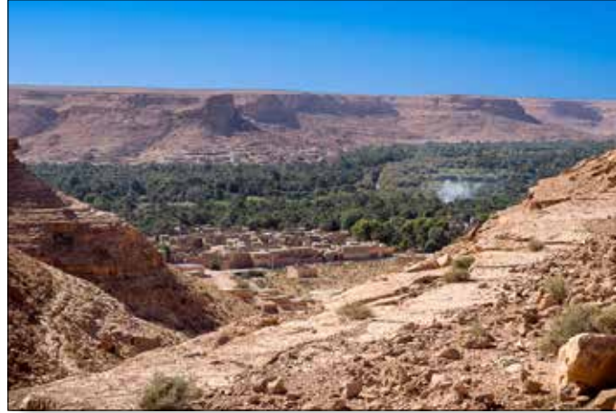
Panorama in de diepte