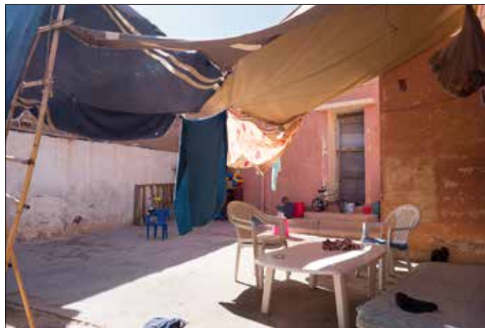
Achter het huis de bediendenvertrekken