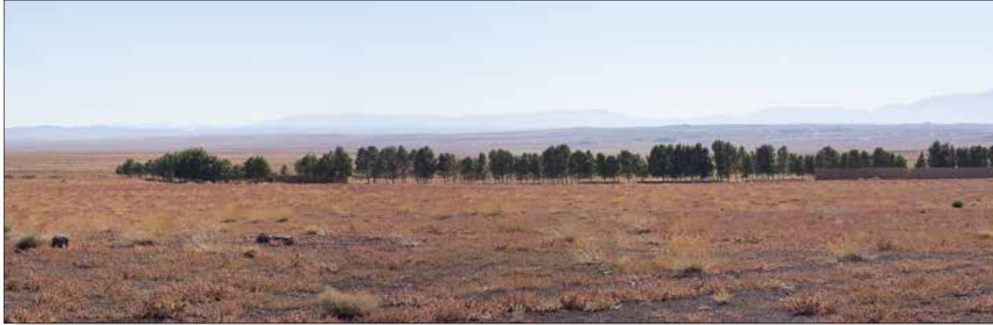
Het grote veld met zoute bodem van een afstand