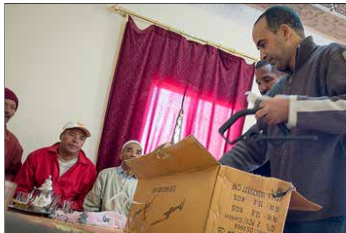
.... die allemaal een olijvenschudapparaat willen kopen