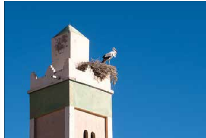
Deze muezzin verstoort mijn slaap echt niet