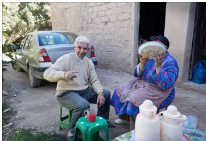
Ma wil niet op de foto; pa laat zich, voor zijn gezondheid, door zijn bijen steken