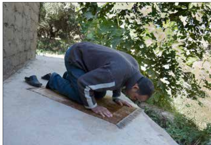
Ondertussen doet de zoon zijn ochtendgebed