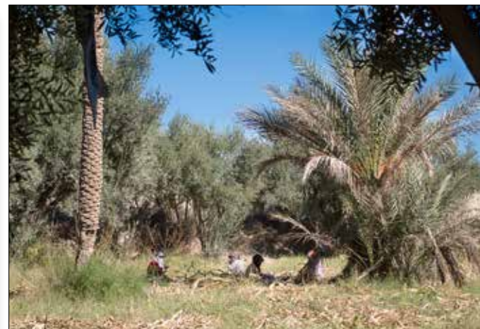
Maïs oogst op "Vaders landje" met olijfbomen op de achtergrond

slaapkamer voor mij ingericht en het huis schoon gemaakt. Alles met zijn bediende, die met vrouw en kind achter het huis woont.