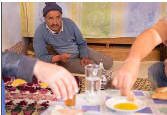
En, op tijd even schaften