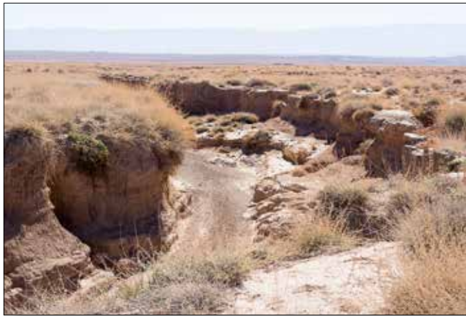
Afgeraden hierin af te dammen