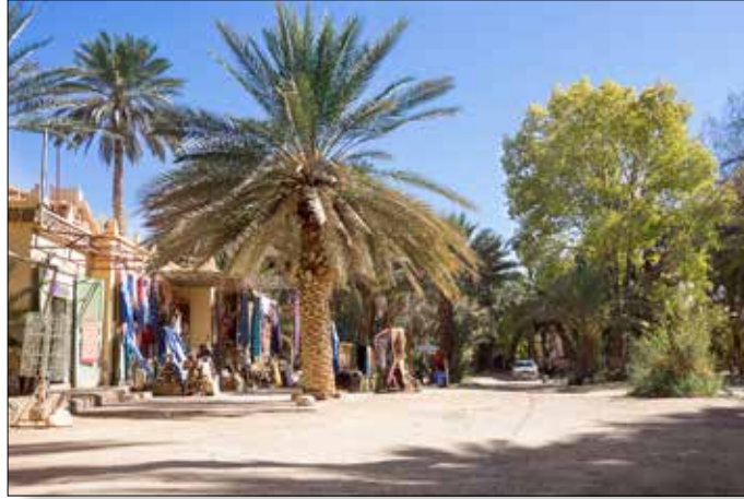
Vakantieoord aan de oase