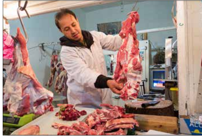
Nog één keer ons maaltje uitzoeken