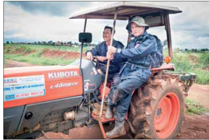
Transport op de plantage

in het arbeidersonderkomen van de plantage hun toevlucht moeten zoeken. Ons kamertje is bedompt en het beddengoed gebruikt, maar we hebben – hoewel primitief in mijn ogen – de beste plaatsen.