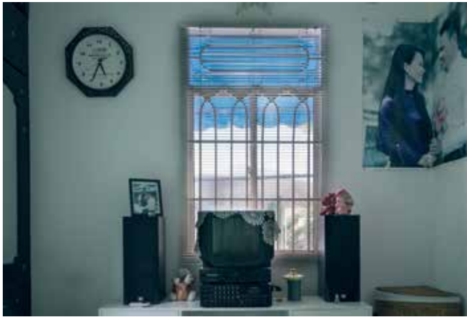
Even rusten in de slaapkamer van Chip & Son