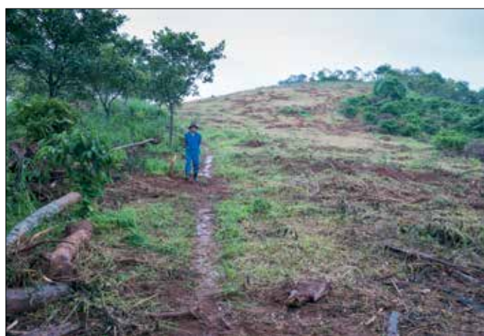
Overzicht van de 1 ha proeffarm