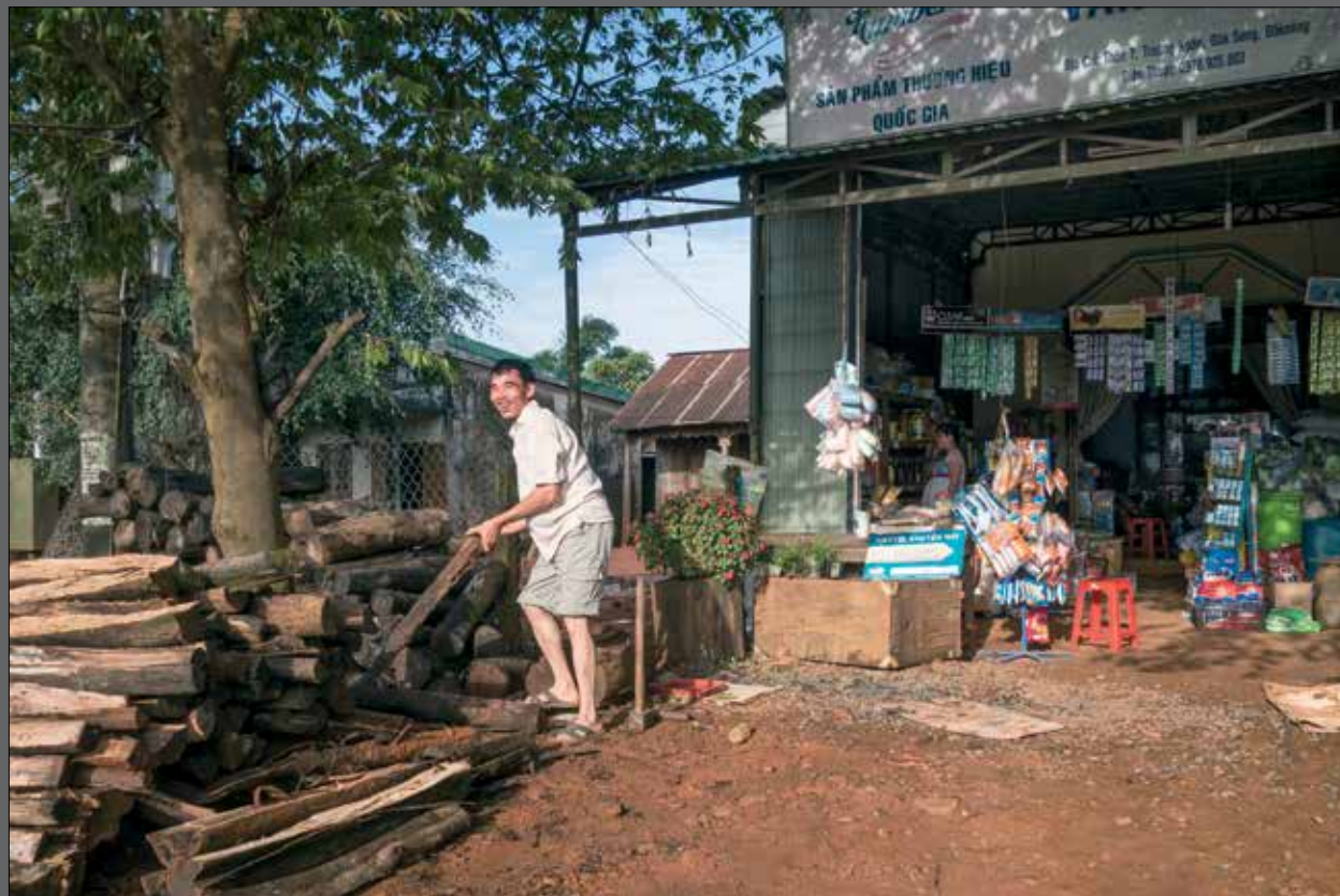
Buurman tegenover mijn guesthouse in Truong Xuan Commune, Dak Song District