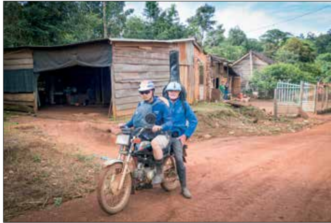
Op weg naar het guesthouse