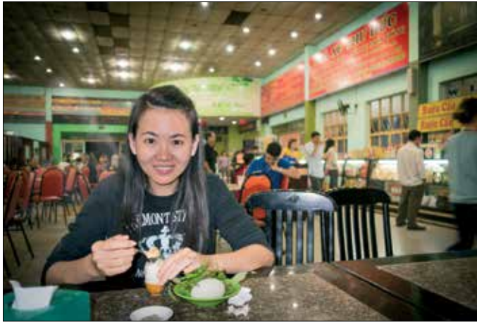
Nachtreisonderbreking: Chip met jong kuiken