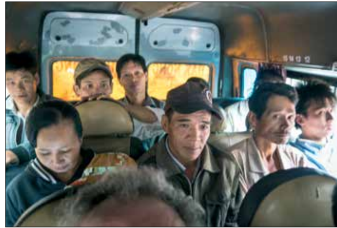
Onderweg in de bus