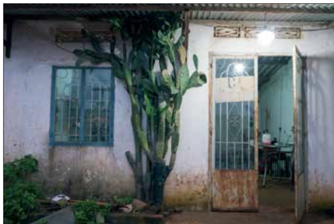
's ochtend vroeg weer terug naar 'huis'