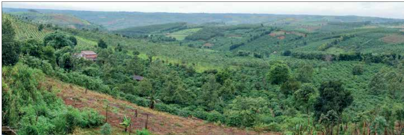
Landschap in de buurt

In het hotel wacht ons een groep veiligheidsambtenaren. De baas, de jongste van het stel, is al begonnen met het bestuderen van mijn paspoort; een adjudant maakt op zijn commando aantekeningen. De waardin sleept limonade blikjes en sigaretten aan. Besloten wordt dat Chip een kopie van mijn gegevens maakt en naar het bureau brengt. Vermoedelijk zal deze kopie daar nu aan de muur hangen, want ik schijn één van de zeer weinige buitenlanders te zijn die deze streek aandoet. Ik word als een VIP gezien.