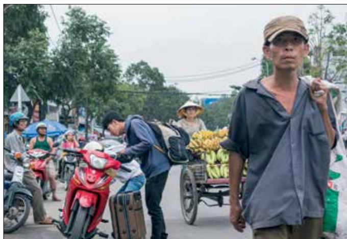
Nabij busstation HCMCity