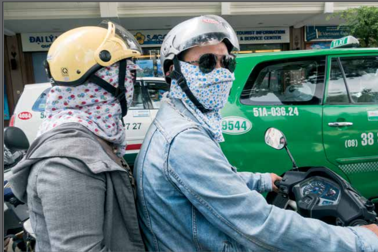
Toch is de lucht in Ho Chi Minh City veel schoner dan in Beijing