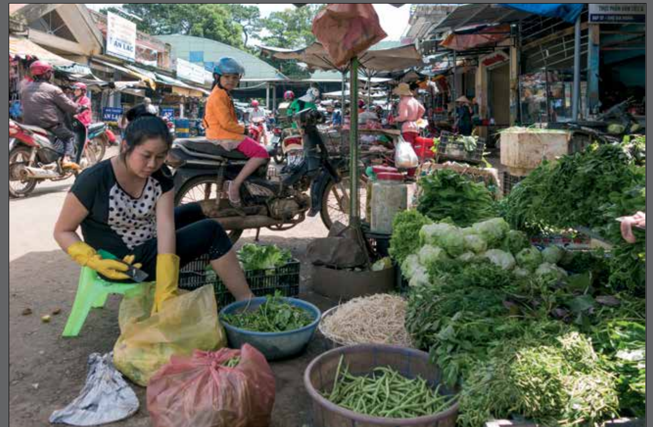
Groenteboer in Gia Ngia, districtshoofdplaats van Dan Song, Dak Nong Province