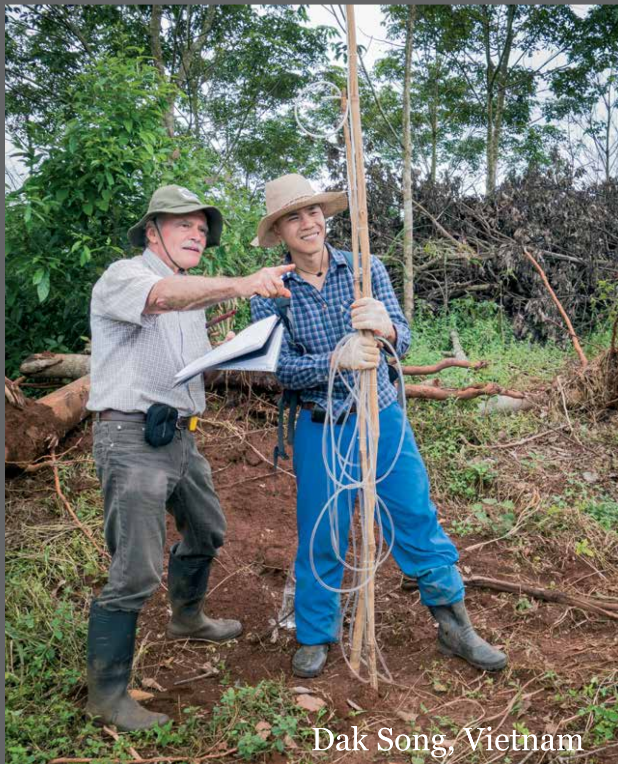
Dak Song, Vietnam