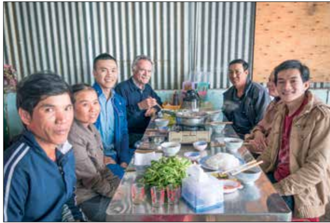
Ontvangst op de bananenplantage