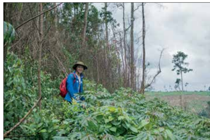
Reconnaissance voor 10 ha farm