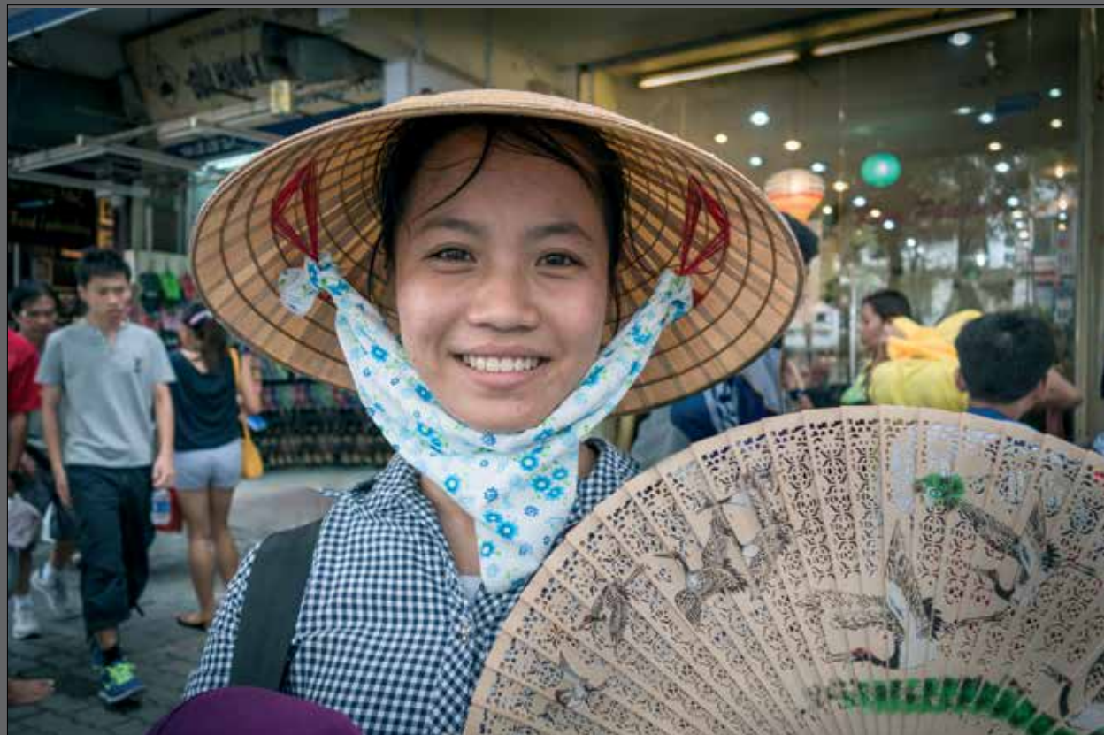
Verkoopster in HCMCity