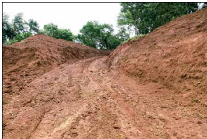
Toegang tot hun farm (2 dagen oud, erosie volgt)