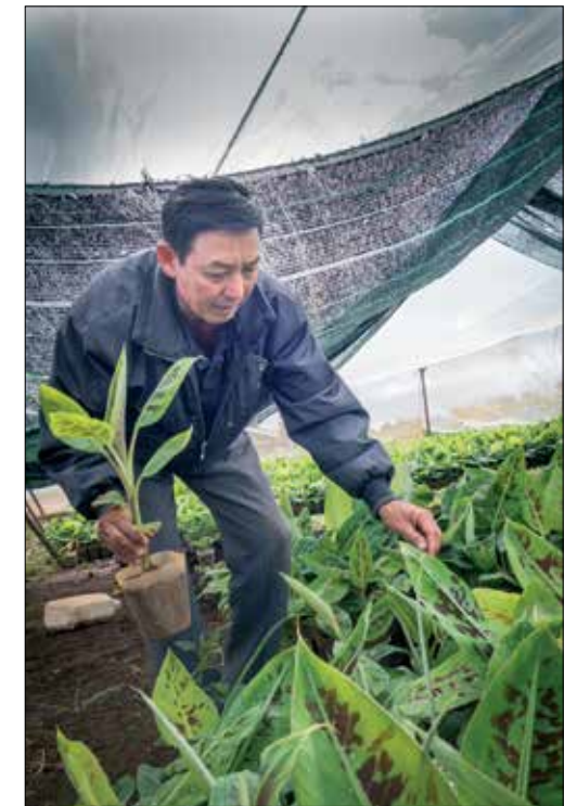
Nguyen houdt van z'n bananen