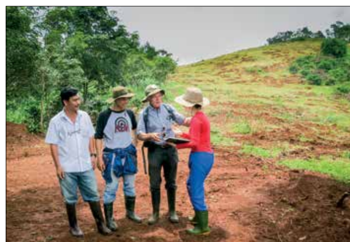
Rondgang met Netafim vertegenwoordiger

De plantage is zo'n 50 ha groot op vlak terrein. Het hele jaar kan geoogst worden en ook hier wordt geïrrigeerd (met sprinklers) om export kwaliteit te bereiken. Het ziet er prima uit en ik hoop dat Son met de manager een goed werkcontact kan opbouwen.