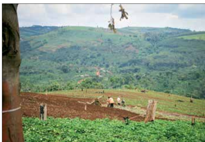
De buren druk met poten van zoete aardappelen