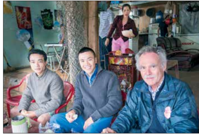
Kopje koffie op het busstation van Gia Ngia