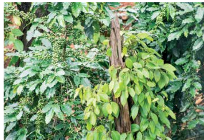
Koffie en peper