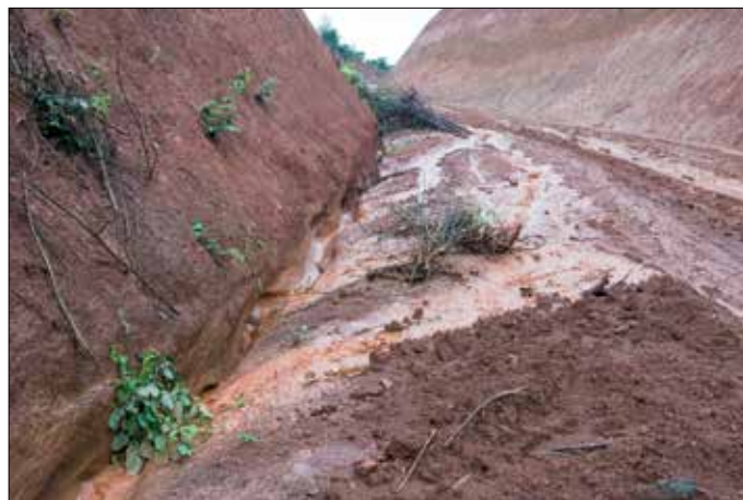
De weg langs hun farm, nabij hun oprit