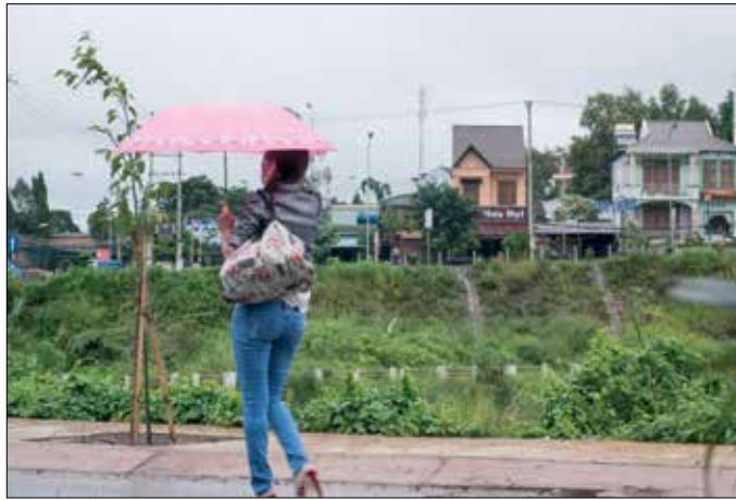
Toch vind ik de Aziatische dames minder sexy