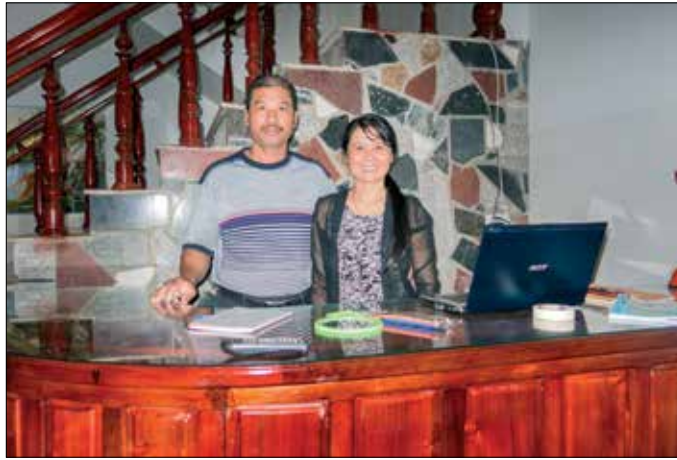
Echtpaar dat guesthouse runt