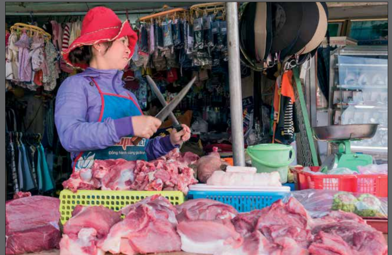
Idem, maar dan de slager