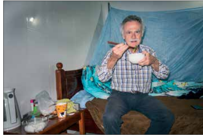
Avondmaaltje op mijn kamer