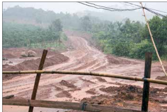
Idem, in de regen vanuit hun overburen gezien