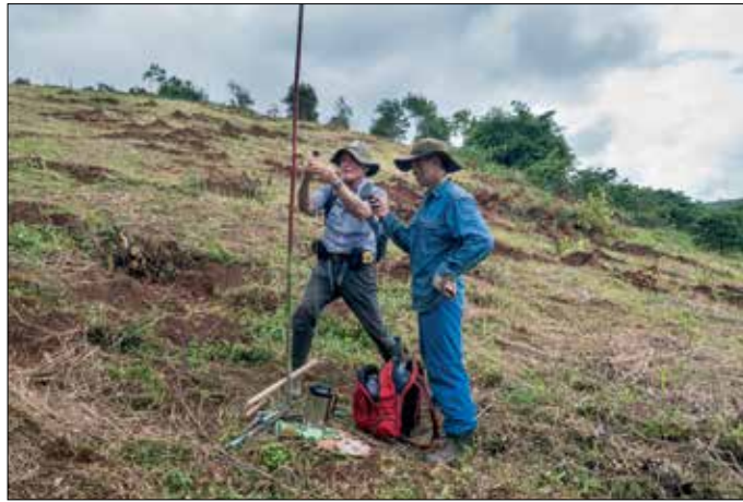
Een rechte hoek uitzetten