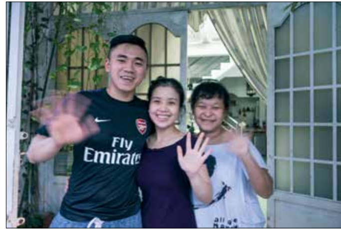
Broer, schoonzus en moeder van Son in HCMCity