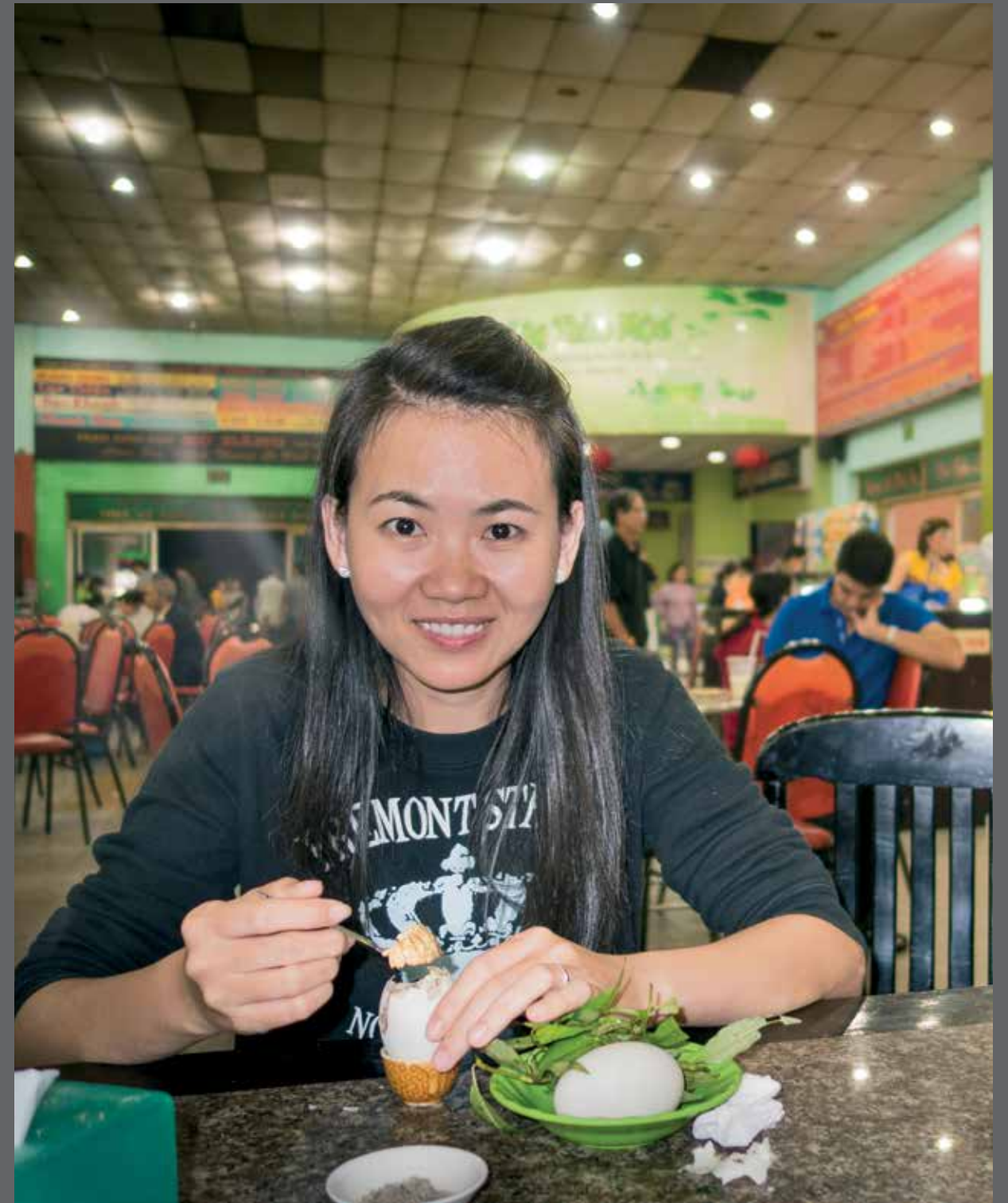
Tekst, foto's en grafische vormgeving: Silvester Povel