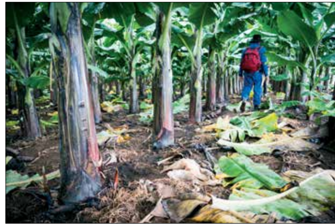
Cavendish bananen zijn wat kleiner